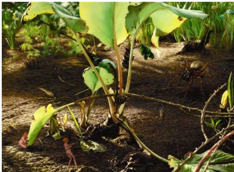
Alexander Zakharov, Gnaphosidae, 2012, oil on wood, 11 x 15cm