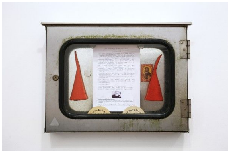
The vision, Schaukasten # 1, KGV Silbermöwe, 2012, Schaukasten, Aushang, Zwergenhüte, Jesusmagnet, Werbung