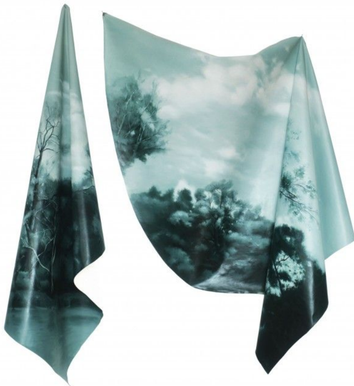
Flavia Pitis, Nature Rehearsal 3, 2017, oil on linen, 165 x 160 x 30cm