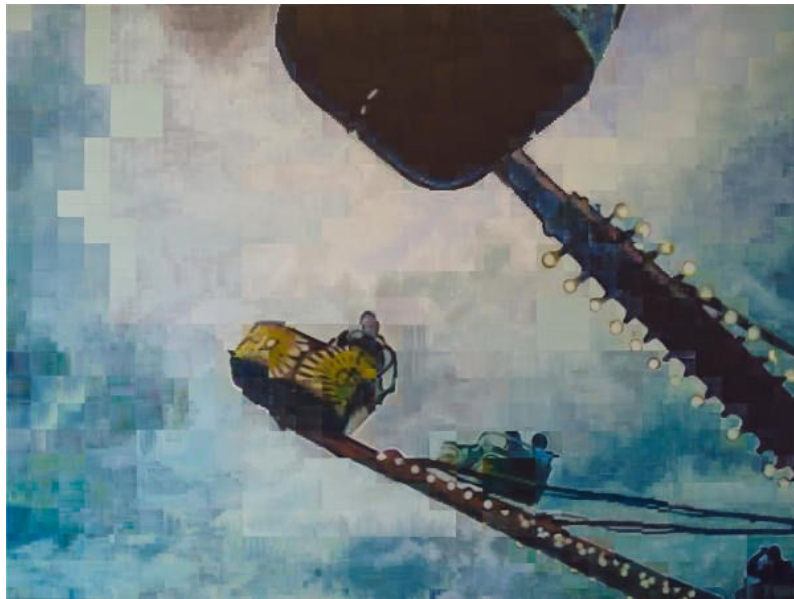
Enda O'Donoghue, Octopus, 2012, oil on canvas, 180 × 240cm