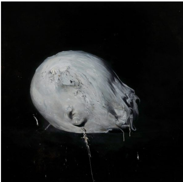
Nicola Samori, Soluzione, 2008-9, Öl auf Kupfer, 100 x 100 cm, Selected Artists Collection, Berlin

Galerie Selected Artists, Uwe Goldenstein, Choriner Straße 49, 10435 Berlin. Tel: 0176 96527308 uwegoldenstein@gmail.com http://selected-artists.com