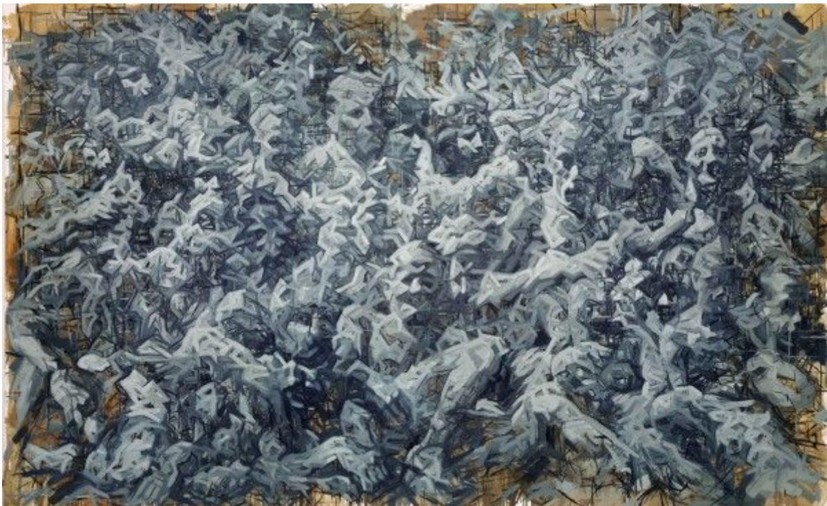
Adam Bota, Rasterfahndung, 2014, Öl auf Leinwand, 170 x 270 cm

28. Sept, 17:00: Künstler- und Kuratorenengespräch / 30. Sept, 15:00: Finissage